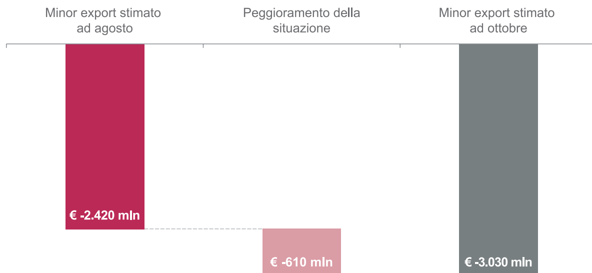
GRAFICO 3. Minor export italiano in Russia - scenario alternativo ad agosto e ottobre 2014